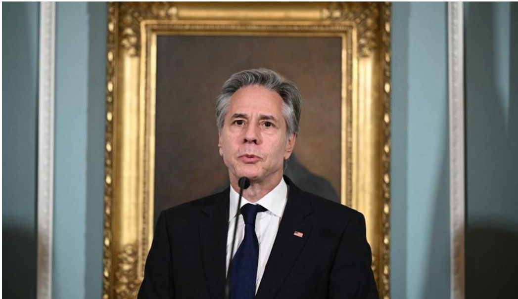
(بليكنك يدي بشهادته أمام الكونغرس الأمريكي)

تكثف واشنطن من ترويجها لدور أردني واضح في الدفاع عن الكيان الصهيوني ضد الهجمات الإيرانية المحدودة التي نفذتها طهران على "إسرائيل" الشهر الماضي. ففي جلسة استماع الكونغرس الأمريكي لوزير الخارجية الأمريكية بليكنك الثلاثاء (٢١ مايو)، قال إن "دولاً في الشرق الأوسط تصدت لجزء من الهجمات الإيرانية على إسرائيل للمرة الأولى وذلك بفضل جهود إدارتنا". في إشارة إلى الأردن التي شكرها بليكنك (٣٠ إبريل الماضي) خلال زيارة له إليه، على دوره في "الحد من الاشتباك بين إيران وإسرائيل". كما أشار السفير الأمريكي لدى "إسرائيل" جاك ليو، الاثنين الماضي، إلى "العمل الموحد لخمسة جيوش - الولايات المتحدة وفرنسا وبريطانيا العظمى والأردن وإسرائيل - التي حلقت في السماء للدفاع عن الدولة اليهودية من هجوم صاروخي وطائرات بدون طيار إيرانية، كمثال لما يمكن أن يكون عليه المستقبل".