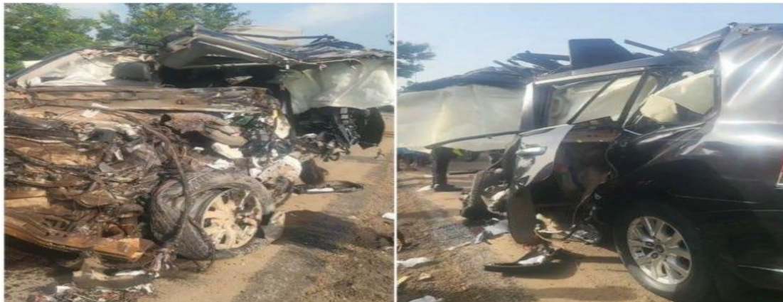
(سيارة الرئيس الغاني)

نجا رئيس غانا "نانا أكوفو" بأعجوبة إثر حادث سير مميت الأحد ووفاة بعض حراسه فيما نقل الرئيس بمروحية الى العاصمة وهو بصحة جيدة. وفي سلوفينيا، أصيب رئيس وزراءها بطلق ناري في محاولة اغتيال سياسية محلية (١٦ مايو). ورغم تزامن هذه الحوادث مع مقتل الرئيس الإيراني في تحطم مروحية إلا أنه لا يبدو أن تلك الحوادث تُعد مؤشراً على عودة قوية لمرحلة الاغتيالات السياسية، بعد أن شهدت دول كثيرة أخرى عودة الانقلابات العسكرية، لكن كليهما يدلان على احتمال اتساع رقعة الفوضى السياسية في العالم.