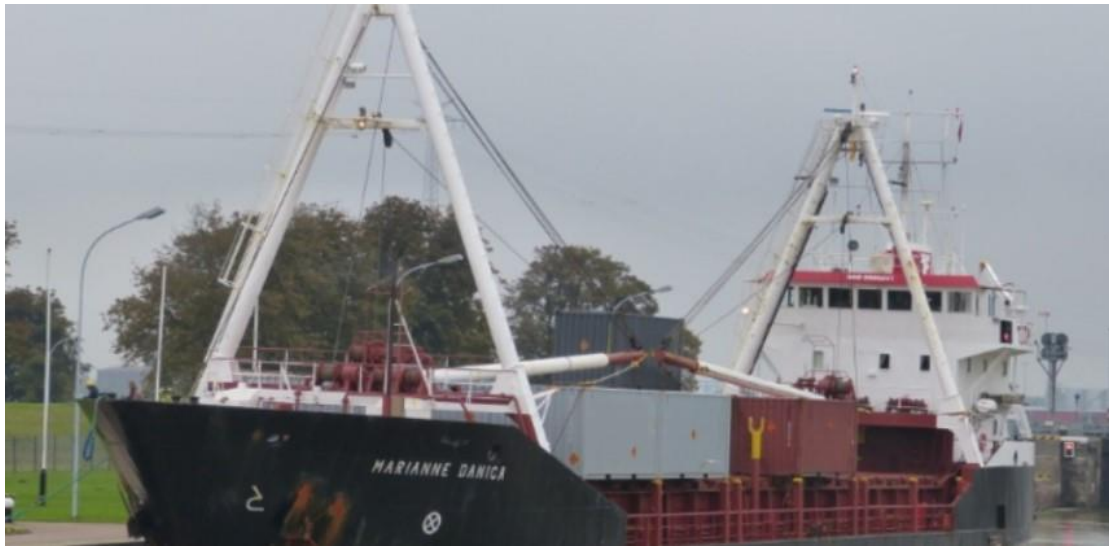
(السفينة الممنوعة من الرسو في الميناء الإسباني)

أكد وزير الخارجية الإسباني خوسيه مانويل ألباريس، الجمعة، إن بلاده لن تسمح للسفن التي تحمل أسلحة لـ"إسرائيل" بالرسو في موانئها، وذلك بعد أن رفضت إسبانيا السماح لسفينة تحمل ٢٧ طناً من المتفجرات من مدراس بالهند إلى حيفا المحتلة، بالرسو في ميناء قرطاجنة بجنوب شرق البلاد اتساقاً مع قرار الحكومة بعدم منح تراخيص لتصدير الأسلحة إلى "إسرائيل"، لأن إسبانيا "لا تريد المساهمة في الحرب".