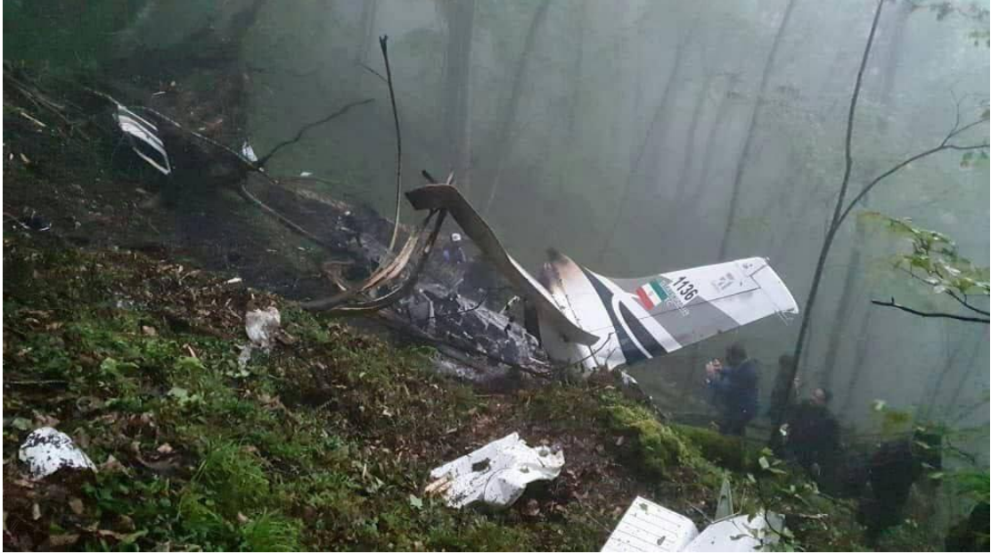
(صورة حطام المروحية التي كانت تقل الرئيس والوفد الإيراني الرفيع لأذربيجان)

فجّر مقتل رئيس دولة إيران، إبراهيم رئيسي ووزير خارجيتها، حسين عبد اللهيان، زلزالاً سياسياً في إيران، فيما يخص مسائل خلافة المرشد الأعلى للثورة الإيرانية، علي خامنئي (٨٥ عاماً)، والذي يعاني اعتلالاً في صحته، وكان القتل أبرز المرشحين لخلافته، ومسألة خلافة الرئيس الإيراني الراحل، وملايسات الحادثة نفسها، والتي ألقت بظلال داكنة على نظام الحكم في إيران وأركانها.