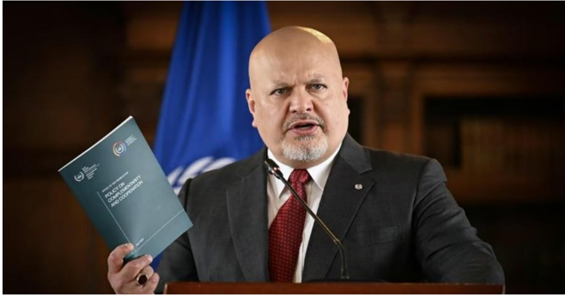
(المدعي العام كريم خان)

طلب المدعي العام للمحكمة الجنائية الدولية، كريم خان، الاثنين، من الدائرة التمهيديية إصدار مذكرات اعتقال بحق ٣ من قادة حماس، وكذلك بحق رئيس الوزراء الصهيوني بنيامين نتنياهو، ووزير حربه يوآف غالانت. وجاء في بيان خان: "إن النيابة العامة لديها أسباب منطقية للاعتقاد بأن زعيم حماس في قطاع غزة يحيى السنوار، وقائد الجناح العسكري للحركة محمد الضيف، ورئيس المكتب السياسي لحماس إسماعيل هنية، وكذلك رئيس الوزراء الإسرائيلي بنيامين نتنياهو، ووزير الدفاع يوآف غالانت، مسؤولون عن جرائم حرب وجرائم ضد الإنسانية ارتكبت في أراضي إسرائيل وفلسطين (في قطاع غزة)، اعتباراً من ٨ أكتوبر ٢٠٢٣".