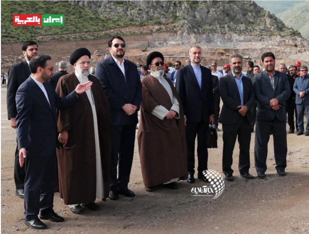
(رئيسي قبل ساعتين من مقتله)

والقتيل، كان عضواً في "لجنة الموت" التي نفذت الآلاف من عمليات الإعدام بحق المعارضين الإيرانيين في صيف عام ١٩٨٨، كما شارك في ارتكاب مجازر ضد الجنود العراقيين، ويعرف رئيسي أيضاً باسم "جزار طهران". وكان مقرباً من خامنئي للحد الذي جعل المرشد يتخذ تدابير كبيرة لضمان فوز رئيسي في الانتخابات مرتين، مما أدى إلى استبعاد العديد من كبار المسؤولين السابقين الآخرين الذين ربما كانوا سيشكلون تحدياً خطيراً له.