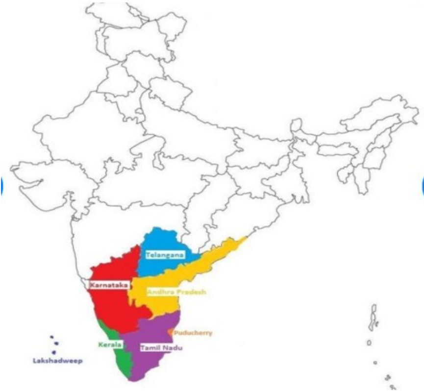
(الولايات الخمس الأكثر كثافة للمسلمين في الجنوب الهندي)