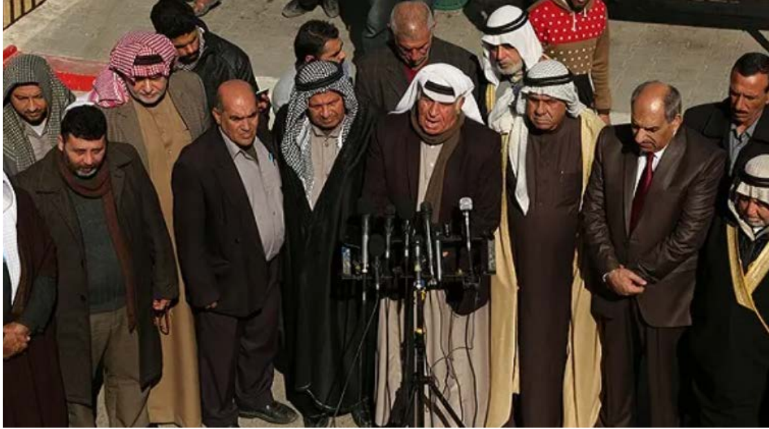
(مخاتير غزة في مؤتمر صحفي يعلنون رفضهم استخدامهم كبديل لسلطة حماس)

وينتمي نحو ٧٢٪ من أهالي غزة لعشائر أو عائلات يبلغ عدد أفرادها أكثر من ألف شخص، وجميعها تقريباً قد دانت بالولاء لحماس في أعقاب سيطرة جناحها العسكري، القسام على غزة في العام ٢٠٠٧، ما عدا عشيرتي دغمش وحلس، اللتين أظهرتا تحدياً لسلطة حماس، ثم ما لبثت أن خضعتا لها بعد تمرد لمدة قصيرة في العام التالي. وارتكبت "إسرائيل" مجازر بشعة بحق العشيرتين خلال عدوانها الحالي، إلا أنها أشاعت مؤخراً أن حماس قتلت مختار عائلة دغمش، وهو ما نفته الحركة والعشيرة معاً قبل أيام.