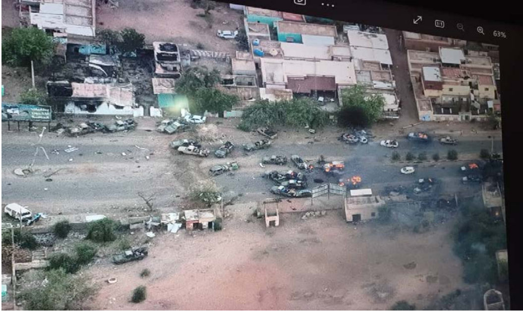
(جانب من المدرعات والآليات الميليشياوي المدمرة بعد هروب فلول قوات حميدتي)

أعلنت القوات قامت بتحييد قوة كبيرة للمليشيا المتمردة، والتي حاولت الهروب من منطقة الاذاعة مع تدمير قوة أخرى مساندة من ناحية الغرب.