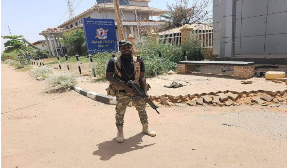
(جندي سوداني يحرس مبنى الإذاعة والتلفزيون بعد تحريره من الميليشيات)

تمكن الجيش السوداني من تحرير مبنى الإذاعة الرسمية في أم درمان بعد معارك انتهت بتحرير المبنى وملاحقة الفلول الهاربة، وتحييدها.