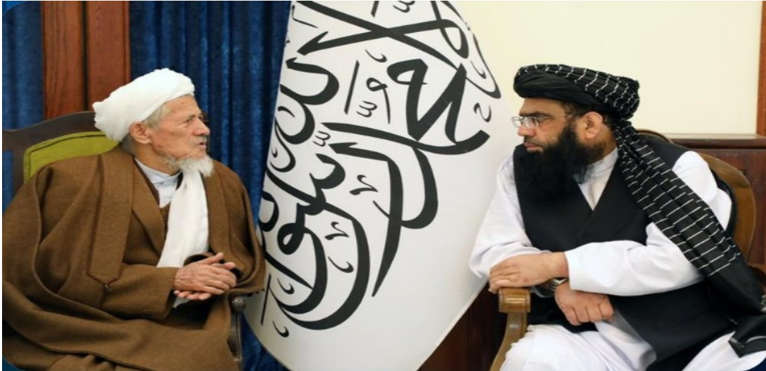
(عبد الكبير خلال لقائه مع ممثلي شيعة بلاده)

وفي الصعيد ذاته، التقى وزير خارجية إمارة أفغانستان الإسلامية مولوي أمير خان متقي الأسبوع الماضي في كابول سفير إيران والممثل الخاص للرئيس، كاظمي قومي، وخلال الاجتماع، جرت مناقشات شاملة بشأن العلاقات الثنائية والتجارة والعبور والتطورات السياسية الإقليمية الأخيرة.