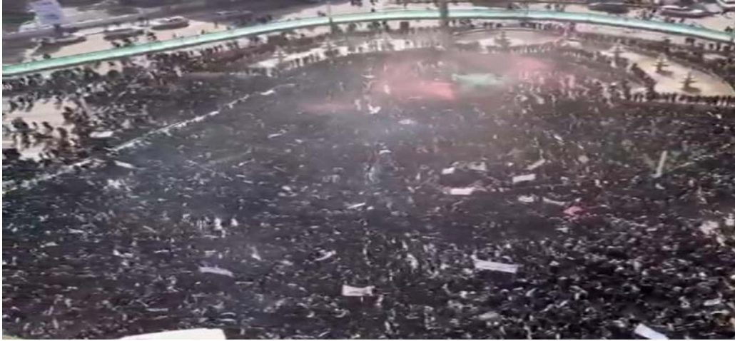
(مظاهرات إدلب ضد الأسد والجولاني)

اندلعت مظاهرات حاشدة في إدلب تطالب برحيل الأسد، وزعيم جبهة النصرة، الجولاني، معاً، نظراً لما يتعرض له السوريون في الشمال من ممارسات رجال الجولاني.