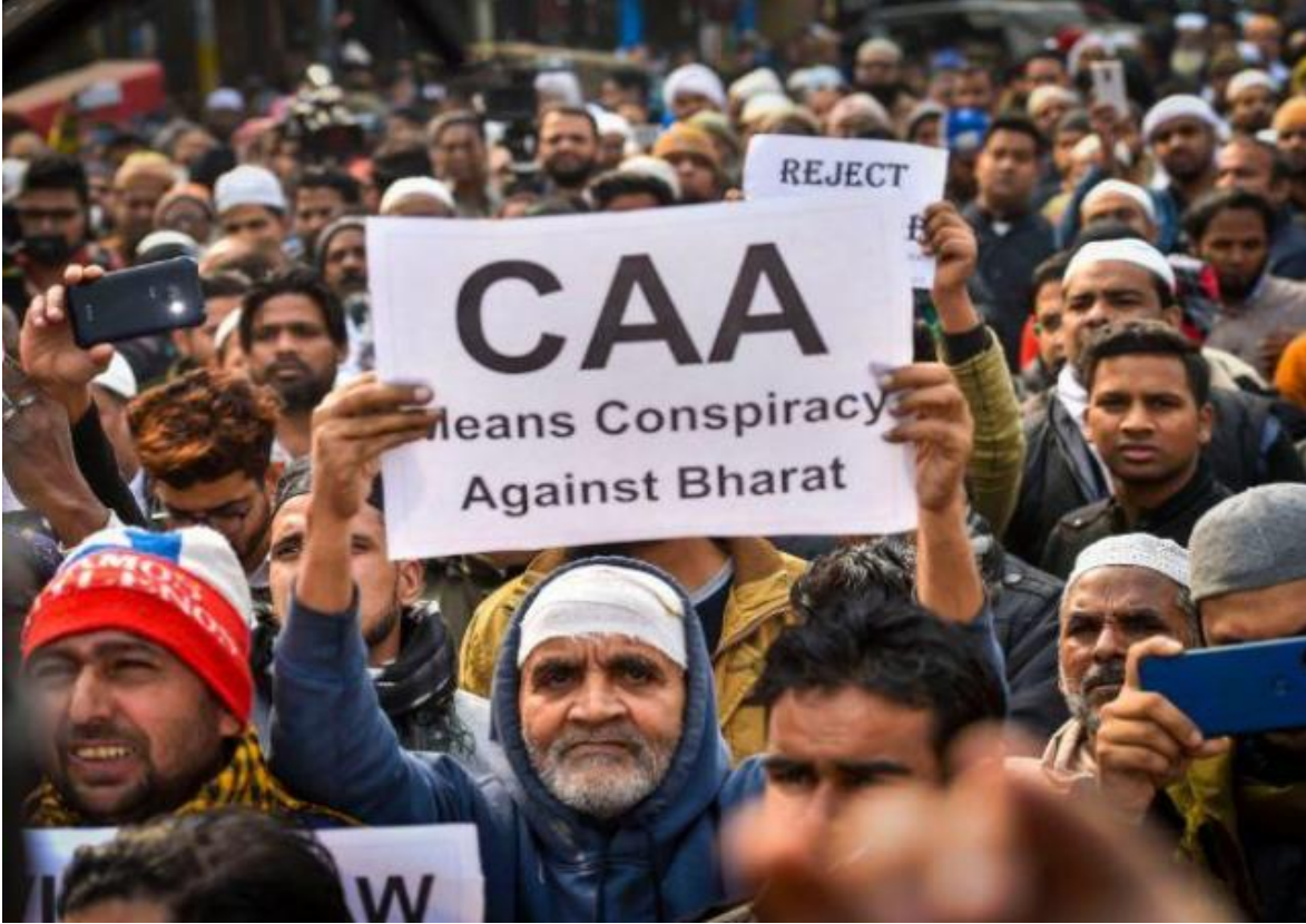
(جانب من المظاهرات ضد قانون CAA التمييزي ضد المسلمين)