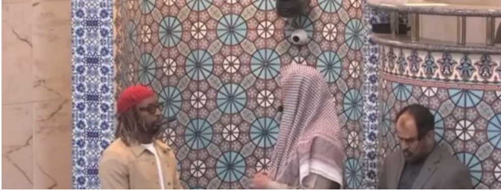
(المغني جون أثناء نطقه الشهادتين)

أعلن مغني الراب ليل جون، اعتناقه الإسلام في مسجد الملك فهد، لوس أنجلوس، الولايات المتحدة، الجمعة الفائتة. وجون مغني شهير، حصلت إحدى ألبوماته على مليار مشاهدة من قبل.