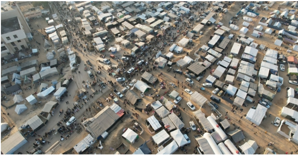
(مخيمات رفح المكتظة باللاجئين)