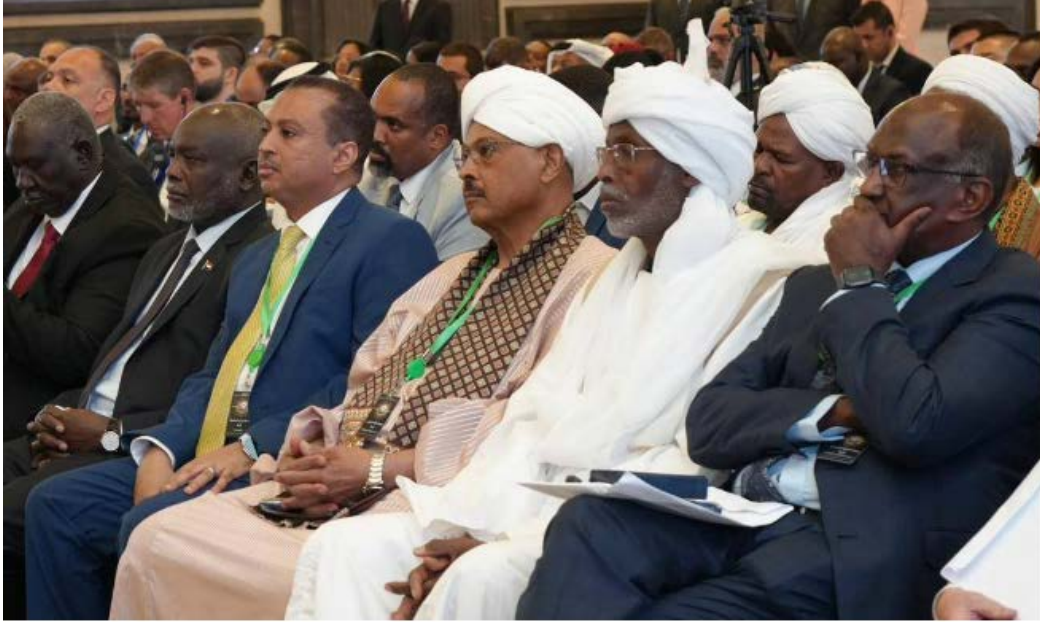
(مؤتمر إنهاء الحرب في السودان الذي استضافته القاهرة)

حضرت الفصائل السياسية السودانية المتنافسة محادثات رسمية للمصالحة في القاهرة ٦ يوليو، وهي الأولى منذ اندلاع الصراع في البلاد قبل ١٥ شهراً تقريباً. وقالت القوى السياسية والمدنية السودانية، إن اجتماع القاهرة يمثل "فرصة قيمة" إذ جمع لأول مرة منذ الحرب الفرقاء المدنيين في السياسة. وشارك في المؤتمر قوى سياسية ومدنية أبرزها تنسيقية القوى المدنية الديمقراطية (تقدم) برئاسة عبد الله حمدوك، ومالك عقار رئيس الحركة الشعبية نائب رئيس مجلس السيادة، وجبريل إبراهيم رئيس حركة العدل والمساواة.