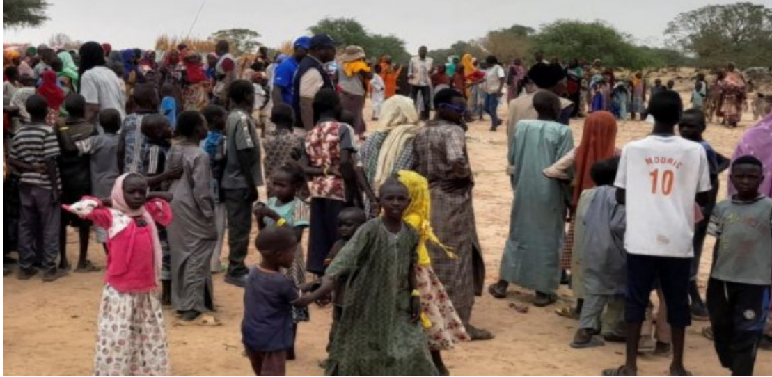
(النازحون من سنجة)

الميليشيات من جرائم، وأخرها ما نفذته في سنار وسنجة والدندر، محيياً "ثبات وتضحيات القوات المسلحة والمشاركة المستنفرين وقوات العمل الخاص"، وفق ما ورد في البيان الصادر في ٧ يوليو الحالي. وفي السياق ذاته، دان رئيس حركة تحرير السودان، مني أركو مناوي، مخرجات مؤتمر القاهرة، وكتب في صفحته على فيس بوك: "نشكر جمهورية مصر العربية الشقيقة التي وفرت للسودانيين ان تجتمع بعد تنازلات ظناً أن المؤتمر يخرج بتعاطف مع الضحايا بإصدار الإدانة على ممارسات الدعم السريع إلا أن البيان الختامي خاب ظنون السودانيين خاصة الضحايا، لذا لسنا معنيين بالبيان لا يحمل تعاطف مع الشعب".