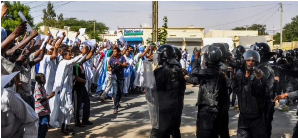
(أنصار اعبيد يحتجون ضد "النتائج المزورة")

أعلن المجلس الدستوري الموريتاني السبت النتائج النهائية لرئاسيات ٢٠٢٤، مؤكداً فوز الرئيس محمد ولد الغزواني بفترة ثانية بنسبة ٥٦,١٢٪ في الانتخابات الرئاسية التي جرت في ٢٩ من يونيو. والتي شابها خروقات كبيرة، وقال المجلس إن المرشح الرئاسي بيرام الداه اعبيد حل ثانياً بنسبة ٢٢,١٠٪، فيما حل ثالثاً زعيم المعارضة ومرشح حزب "تواصل" (إسلامي) حمادي المختار بنسبة ١٢,٧٨٪. وفيما رفض اعبيد النتائج، متهماً السلطات القضائية والأمنية بتزوير الانتخابات، مطالباً أنصاره بالتظاهر، اعترف زعيم المعارضة الموريتانية حمادي ولد سيد المختار، بنتائج اللجنة الوطنية للانتخابات الرئاسية، قائلاً إنها "متطابقة" مع المعطيات التي جمعتها حملته، وأجرى اتصالاً هاتفياً بالرئيس محمد ولد الغزواني، وهنأه بمناسبة الفوز بمأمورية ثانية. وأعلن حزبه التجمع الوطني للإصلاح والتنمية "تواصل"، دعم الرئيس محمد ولد الغزواني في ولايته القادمة.