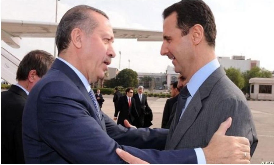
(أردوغان والأسد في لقاء قبل قتل الأخير مئات آلاف السوريين في مجازر جماعية)

قال الرئيس التركي رجب طيب أردوغان إنه بمجرد أن يتخذ بشار الأسد خطوة لتحسين العلاقات مع تركيا، فسوف نبادر بالاستجابة بشكل مناسب. وسنوجه دعوتنا لبشار في أي لحظة، آمليين بعودة العلاقات لما كانت عليه في الماضي.