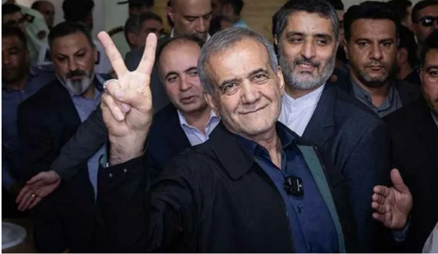
(الرئيس الإيراني المنتخب مسعود بزشكيان)

أكدت مصادر المعارضة الإيرانية أن الانتخابات الرئاسية قد شهدت مقاطعة نحو ٨٨-٩١٪ ممن يحق لهم التصويت فيها. ودلل موقع مجاهدي خلق اليساري المعارض لحكم الملاي على عزوف الناخبين عن الانتخابات بشواهد من مناطق بارزة في قلب العاصمة الإيرانية طهران، أثناء جولتي الانتخابات في ٢٨ يونيو وه يوليو، قالت إن مراكز الاقتراع كانت فيها شبه خاوية، وقد أغلق بعضها بسبب الركود، و"وقف عناصر الباسيج في ساحة التوحيد يدعون الناس للتصويت مقابل المال"، بحسب المنظمة المعارضة. وأجبر شح الإقبال على اعتراف النظام في إحصاءاته الرسمية على الاعتراف بـ"أدنى نسبة إقبال"، وعكست وسائل إعلام النظام ذلك بعبارات مثل "الانهيار الكامل" و"فحط الأصوات" و"الإقبال غير المتوقع". وهو ما أزعج النظام نفسه؛ فأخرج روايته القائلة بأن نسبة الحضور تجاوزت ٤١٪ ممن يحق لهم التصويت.