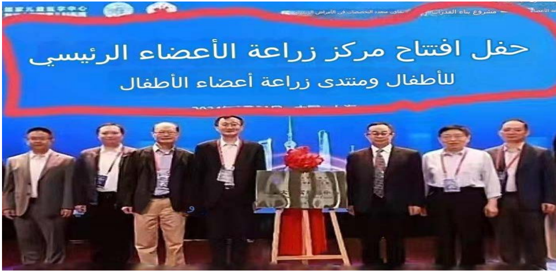
(صورة نشرها صالح هدايار لافتتاح مركز طبي يبيع أعضاء الأطفال المسلمين)

كشفت صحيفة سياست الهندية في تقرير لها نشرته في ٧ يوليو الحالي، عن أن الصين ترتكب جريمة كبيرة ببيع أعضاء مسلمي تركستان الشرقية للمرضى المسلمين، مستشهدة بما أكده خبراء في جلسة استماع للجنة في الكونجرس الأمريكي في مارس ٢٠٢٤، إن أعضاء الأويغور هي الأغلى ثمناً، ويتم تسويقها تحت مسمى "أعضاء الحلال" للسياح الطبيين المسلمين من دول الخليج، حسبما ذكرت وكالة أنباء تركستان برس. وتنقل عن تقارير حملت ما أسمته بمزاعم خطيرة بأن الحكومة الصينية متورطة في الحصاد القسري للأعضاء من المرضى الذين لم يصلوا إلى مرحلة الموت الدماغي بعد، وربما السجناء، وبيعها في السوق السوداء.