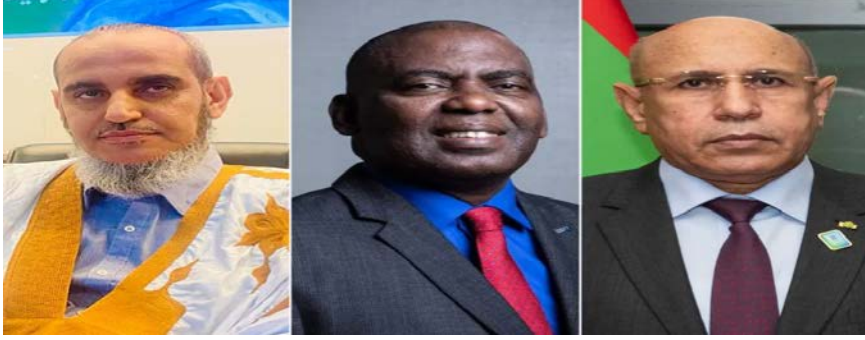
(الغزواني - اعبيد - المختار)

أعلن المجلس الدستوري الموريتاني السبت النتائج النهائية لرئاسيات ٢٠٢٤، مؤكداً فوز الرئيس محمد ولد الغزواني بفترة ثانية بنسبة ٥٦,١٢٪ في الانتخابات الرئاسية التي جرت في ٢٩ من يونيو. والتي شابها خروقات كبيرة، وقال المجلس إن المرشح الرئاسي بيرام الداه اعبيد حل ثانياً بنسبة ٢٢,١٠٪، فيما حل ثالثاً زعيم المعارضة ومرشح حزب "تواصل" (إسلامي) حمادي المختار بنسبة ١٢,٧٨٪. وفيما رفض اعبيد النتائج، متهماً السلطات القضائية والأمنية بتزوير الانتخابات، مطالباً أنصاره بالتظاهر، اعترف زعيم المعارضة الموريتانية حمادي ولد سيد المختار، بنتائج اللجنة الوطنية للانتخابات الرئاسية، قائلاً إنها "متطابقة" مع المعطيات التي جمعتها حملته، وأجرى اتصالاً هاتفياً بالرئيس محمد ولد الغزواني، وهنأه بمناسبة الفوز بمأمورية ثانية. وأعلن حزبه التجمع الوطني للإصلاح والتنمية "تواصل"، دعم الرئيس محمد ولد الغزواني في ولايته القادمة.