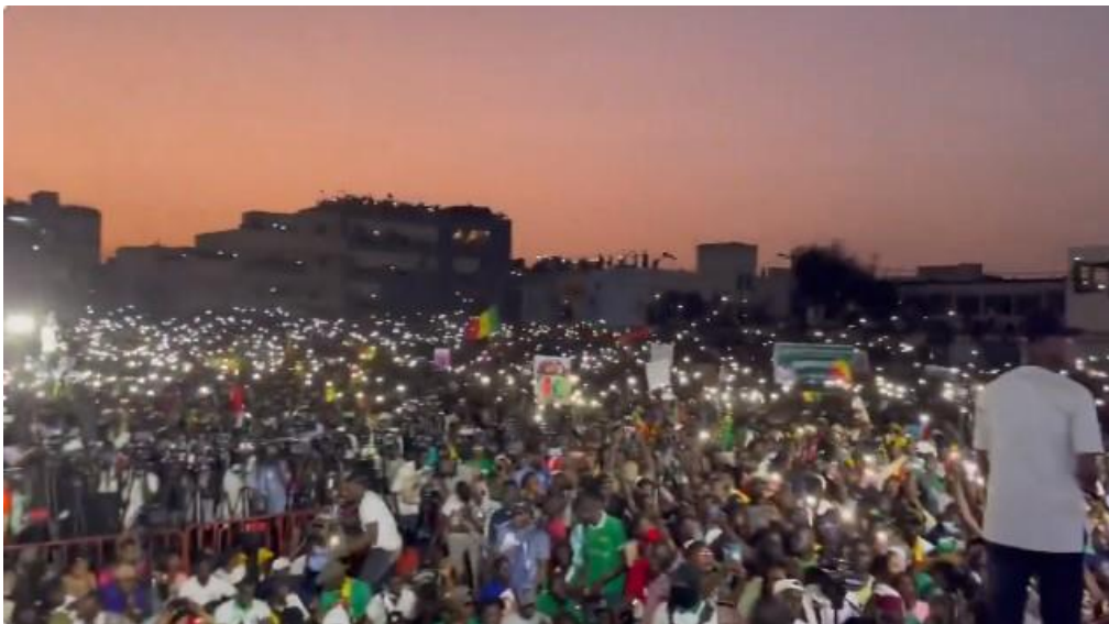
(مظاهرات تعدم السنغال احتجاجاً على تأجيل الانتخابات لمصادرة إرادة الشعب السنغالي وفرض رئيس فرنسي عليه)