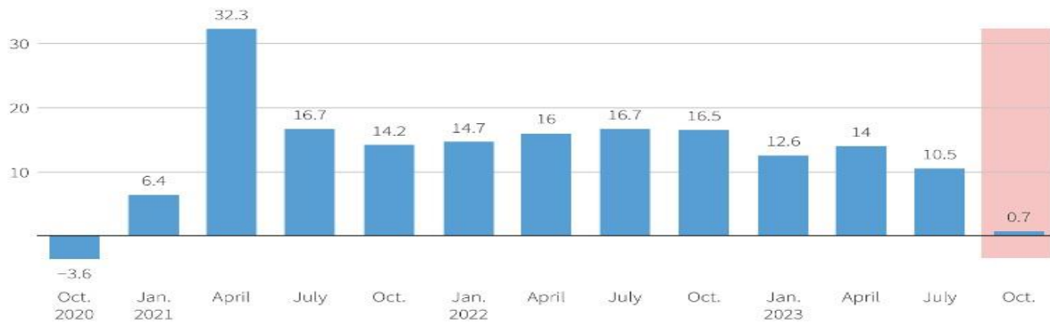
• Comparable sales growth in IDL markets

بيان صحفي صادر عن محكمة العدل الدولية ٦ فبراير: "تم انتخاب القاضية جوليا سيبوتيندي (من أوغندا) اليوم نائبة لرئيس محكمة العدل الدولية من قبل أقرانها، لمدة ثلاث سنوات".