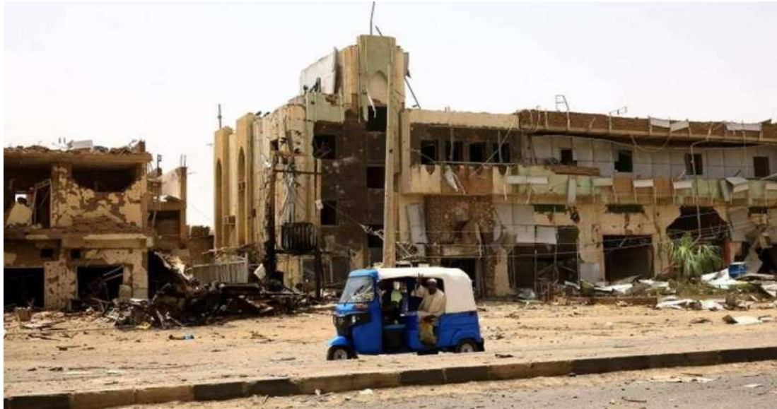
(أم درمان التي دمرتها الحرب)

حقق الجيش السوداني والمقاومة الشعبية انتصارات حاسمة في مدينة أم درمان على قوات الدعم السريع.