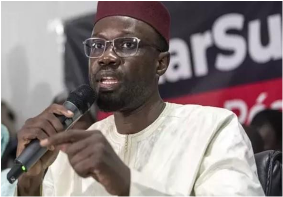
(المرشح المستبعد عثمان سونكو)

قال الرئيس السنغالي ماكاي سال إن الخلاف الناشب بين برلمان بلاده والمجلس الدستوري الأعلى للبلاد كان باعثه على إجراء إجراء الانتخابات الرئاسية التي كان مقرراً إجراؤها ٢٥ فبراير الحالي "حتى لا تشوبها شائبة"، داعياً إلى حوار وطني شامل في البلاد حول ضمانات النزاهة الانتخابية. واندلعت احتجاجات كبيرة في السنغال رفضاً لسياسة النظام السنغالي الموالي لباريس، والذي يصر على استمرار خضوعه للدولة "المستعمرة" التي لم تزل تمسك بمفاصل الحكم السنغالي حتى الآن. وكان المجلس الدستوري السنغالي قد استبعد ترشيح عثمان سونكو للانتخابات الرئاسية منذ ثلاثة أسابيع، بزعم أن ملفه "غير مكتمل". ونظرت المعارضة السنغالية لاستبعاد سونكو الذي يلاقي عراقيل متوالية منذ أعوام لمنعه من الترشح، على أنه تأمر من قبل الدولة العميقة الموالية لفرنسا.