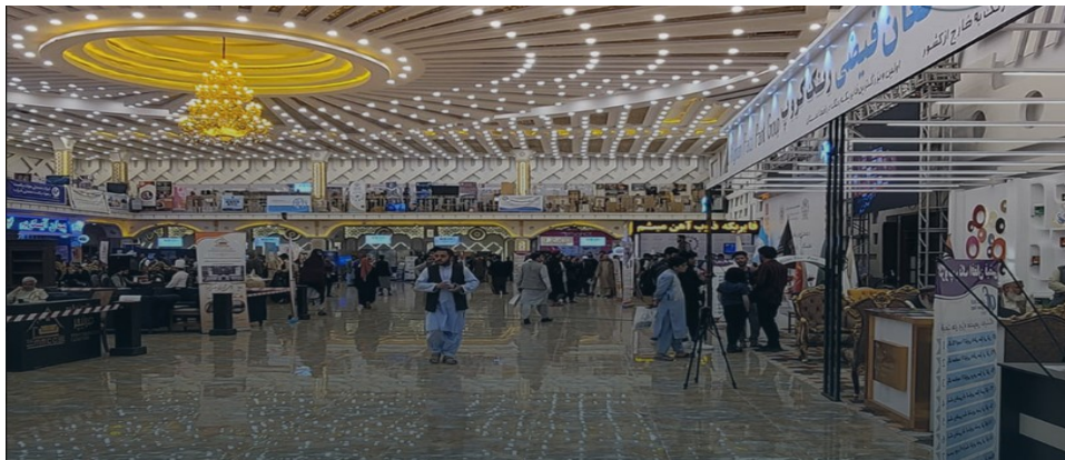
(المعرض الدولي بالعاصمة الأفغانية)

(قطار التطوير ماضي في أفغانستان، وتلك صورة لقسم الشؤون القنصلية بوزارة الخارجية الأفغانية) ومن جهة أخرى، توالى الأنباء الواردة من أفغانستان هذا الأسبوع، مبشرة باقتصاد واعد، من خلال الإعلان عن إنجاز أو الشروع في العديد من المشروعات الاقتصادية النافعة للشعب الأفغاني. وقد أعلنت وزارة الصناعة والتجارة عن تنفيذ مشاريع متنوعة بقيمة ٣٣ مليون أفغاني في مدينة قندهار الصناعية. وأوضحت الوزارة أن هذه المشاريع تشمل بناء الجدار الوقائي وتحسين الطرق في منطقة قندهار الصناعية. ويضم المجمع الصناعي حاليًا ٣٠٠ مصنع تصنيع، منها ٢٠٠ مصنع نشط. وفي كابول، تم التوقيع على ١٣ اتفاقية تجارية بقيمة تجاوزت ٢٠٠ مليون دولار بين المسؤولين الأفغان وتركمانستان. أعلن مسؤولون في وزارة الصناعة والتجارة أن هذه الاتفاقيات تمت بغرض تعزيز العلاقات الاقتصادية بين البلدين. وتشمل هذه الاتفاقيات صادرات منتجات متنوعة من أفغانستان إلى تركمانستان.