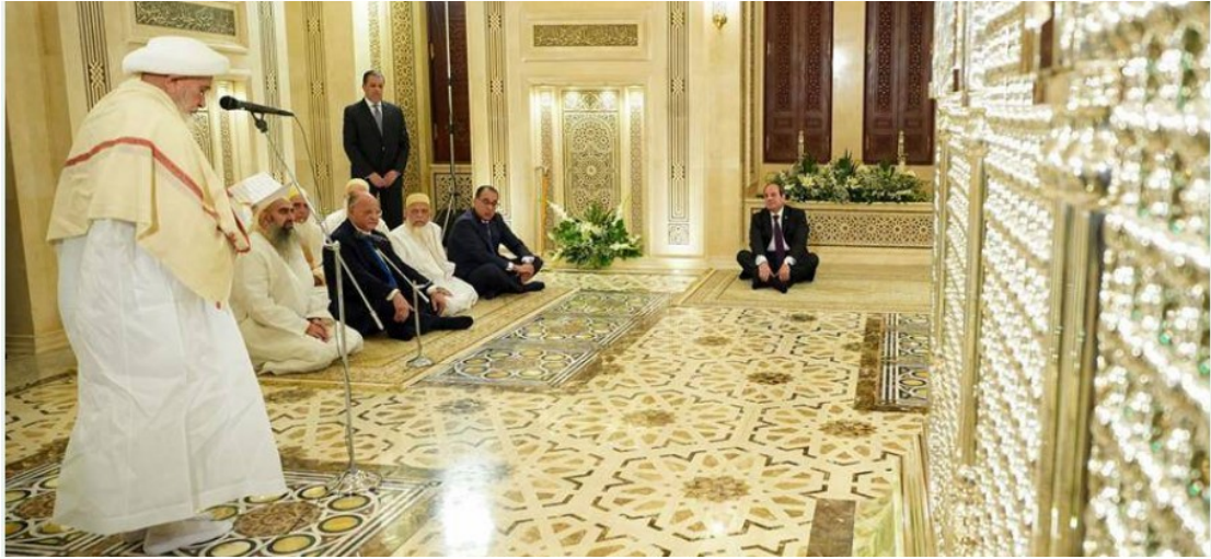
(سلطان البهرة يلقي كلمة أمام الضريح في حضور الرئيس المصري)

افتتح الرئيس المصري عبد الفتاح السيسي، رفقة مفضل سيف الدين، سلطان البهرة، الأحد، مسجد "السيدة زينب" (وسط القاهرة)، بعد تطويره بشكل كامل، وأشاد السيسي بإسهامات هذه الطائفة قائلاً: "إن مشاركتكم ومساهماتكم مقدرة ولها دلالة كبيرة على حب أهل البيت والبذل من أجلهم". وتغض القاهرة الطرف عن عقيدة البهرة الإسماعيلية الباطنية مقابل الإنفاق الباذخ لقادة الطائفة على تجديد مساجد "آل البيت" في القاهرة، والتي ترنو الطائفة من خلالها إلى وضع المساجد التي بناها أو اعتنى بها العبيديون في واجهة المساجد الكبرى في القاهرة القديمة، بغية تضخيم الحالة الشيعية في مصر وصبغها باللون الطائفي.