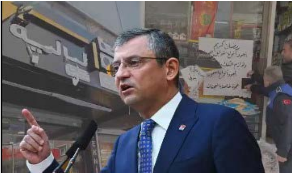
(زعيم الحزب المعارض مخففاً من لهجته تجاه اللغة العربية والسوريين)

كشفت صحيفة "صباح" المقربة من دوائر القرار التركية، عن مشروع تعمل عليه الحكومة ويتلخص في توظيف المهاجرين وعلى رأسهم السوريين في قطاعات معينة.