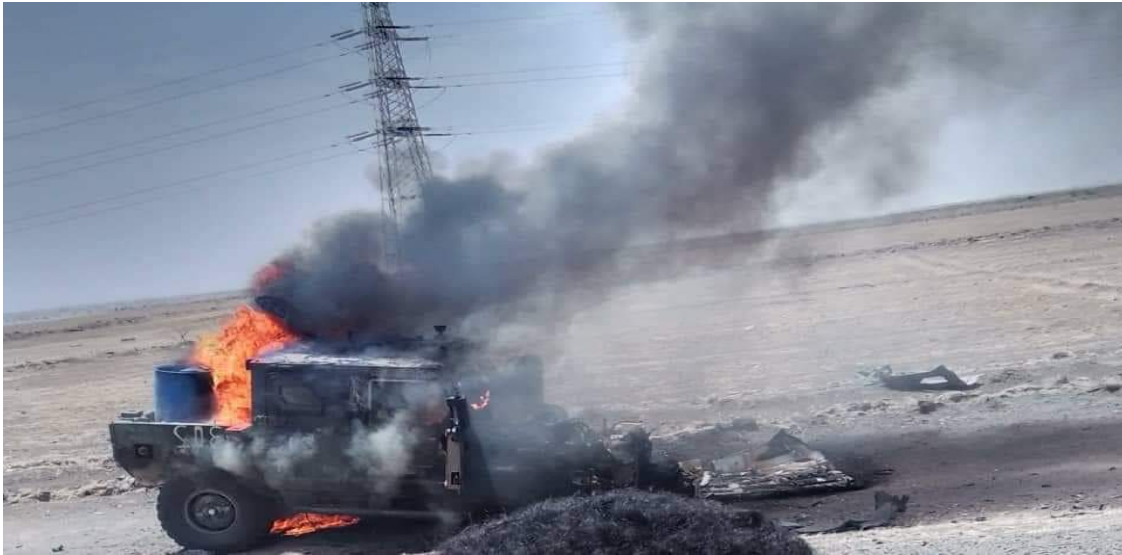
(إحدى عربات الدعم التي دمرها الجيش السوداني في المعارك)

فيما تحاول الرياض تجديد مساعيها للمفاوضات بين مجلس السيادة السوداني وقوات الدعم السريع، أكد رئيس مجلس السيادة والقائد العام للقوات المسلحة، الفريق أول ركن عبد الفتاح البرهان، أنه "لا مفاوضات ولا سلام ولا وقف إطلاق نار إلا بعد دحر هذا التمرد والخلاص من هؤلاء المتمردين المجرمين ليعيش هذا الوطن بسلام".