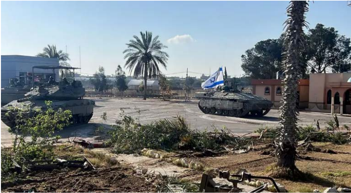
(رفع العلم الصهيوني فوق دبابة في الجانب الفلسطيني من معبر رفح مثل إهانة للقاهرة)

ظهرت دلائل متعددة على زيادة التوتر بين النظامين الصهيوني والمصري، على خلفية غضب القاهرة من تجاوزها في التنسيق حول معبر رفح، ورفع العلم الصهيوني على الجانب الفلسطيني من معبر رفح الحدودي، بعد أن دخلت الدبابات الصهيونية محور صلاح الدين لأول مرة منذ عام ٢٠٠٥ قبل أسبوع.