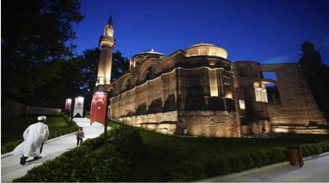
(مسجد كارييا/كنيسة خورا سابقاً)

أكد الرئيس التركي رجب طيب أردوغان أن بلاده تعالج العديد من أنصار حركة حماس. جاء ذلك خلال المؤتمر الصحفي الذي جمعه مع رئيس وزراء اليونان ميتوشاكس. وقال أردوغان: "لا أرى حماس منظمة إرهابية، أعتقد أنهم يحاولون حماية أرضهم وشعبهم، لا توجد منظمة إرهابية هناك، أكثر من ألف عضو من أنصار حماس يتلقى العلاج في مستشفياتنا". وأثار تصريح أردوغان جدلاً واسعاً بعد أن بثت صحف وقنوات تركية وغربية خبراً يفيد بأن أردوغان تحدث عن علاج "مقاتلي" حماس وليس "أنصارها"، إلا أن الرئاسة التركية عادت وأكدت على طبيعة المصايين المدنية.