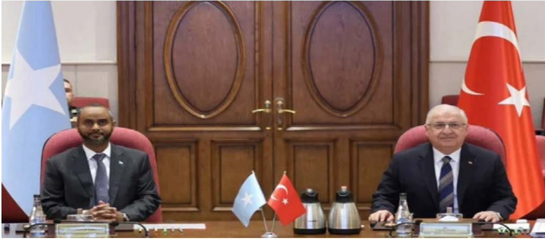
(وزير دفاع تركيا والصومال أثناء التوقيع على الاتفاق الإطاري)

وافق كل من مجلس الوزراء الصومالي والبرلمان الفيديرالي في جلستين منفصلتين في مقديشو اليوم على اتفاقية للتعاون الدفاعي والاقتصادي بين الحكومتين الصومالية والتركية. وتنص الاتفاقية التي تمتد عشر سنوات على نشر القوات البحرية التركية في المياه الصومالية لحماية السواحل الصومالية من الإرهاب وعمليات القرصنة والصيد الجائر والنفائيات البحرية. وبموجب الاتفاق، الذي تم الإعلان عنه الأربعاء (٢١ فبراير)، ستوفر تركيا التدريب والمعدات للبحرية الصومالية حتى تتمكن من حماية مياهها الإقليمية بشكل أفضل من التهديدات مثل الإرهاب والقرصنة و"التدخل الأجنبي".