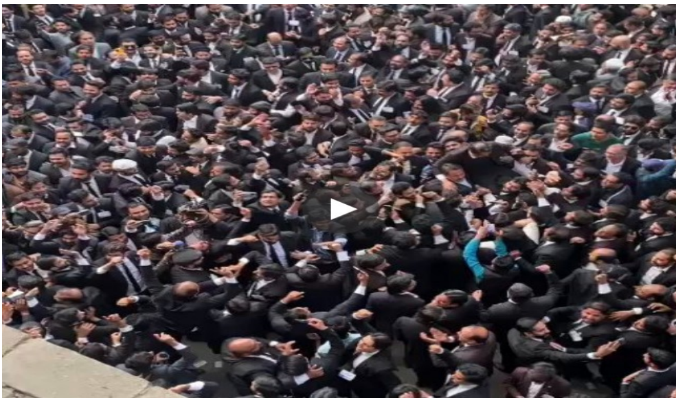
(تأييد كبير من محامي باكستان لحزب الإنصاف)