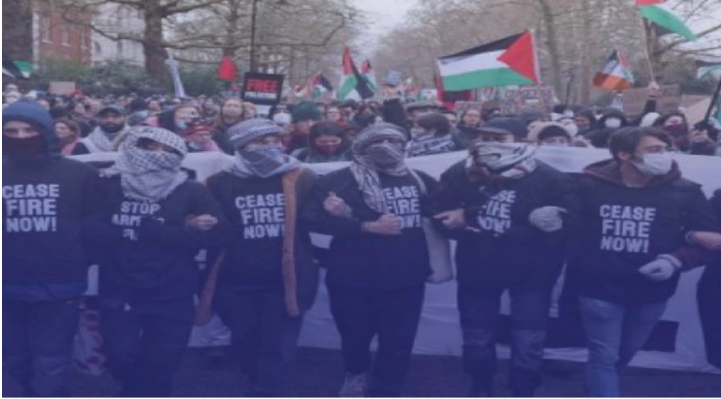
(ملثمون خشية المضايقات يتظاهرون لوقف إطلاق النار في غزة)

جاء حزب المحافظين، نائب رئيس الحزب، نائبه في البرلمان، لي أندرسون، من عضويته في الحزب، بعد رفضه الاعتذار عن تصريحاته خلال المقابلة قال فيها أن "الإسلاميين" سيطروا على عمدة لندن صادق خان.