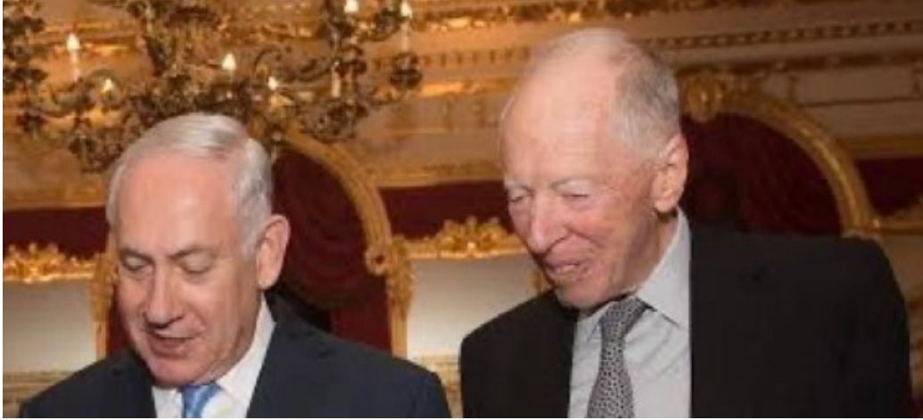
(روتشيلد ونتنياهو أثناء مشاهدة مخطوطة أثرية يهودية)

وفاة عميد عائلة روتشيلد، المصرفي ورجل الأعمال البريطاني، اللورد جاكوب روتشيلد، عن عمر يناهز ٨٨ عاماً، وتعتبر العائلة من أكبر مصادر التمويل اليهودي في العالم. د رئيس وزراء كوسوفا كورتي، الذي تحدث بعد رئيس الوزراء الصربي برنابيتش في الجلسة التي عقدها البنك الأوروبي، على تصريح نظيره الصربي بأنهم يعتبرون كوسوفا "جزءاً من صربيا" لاستخدامه لمصطلح "كوسوفو وميتوهيا". وأكد كورتي أيضاً أن ١١٧ دولة، ٢٢ دولة عضو في الاتحاد الأوروبي و٢٦ دولة عضو في الناتو، تعترف باستقلال كوسوفا. غانا بصدد إصدار قانون دعمه المسلمون والنصارى في البرلمان، يعاقب على الترويج لممارسة الشذوذ الجنسي بالسجن لمدة تصل إلى ١٠ سنوات. ويُعاقب على ممارسة الشذوذ بالفعل في الدولة الواقعة في غرب إفريقيا بالسجن لمدة تصل إلى ثلاث سنوات، وقد يرتفع ذلك إلى خمس سنوات بموجب مشروع القانون. رئيس الجزائر يفتتح أكبر مسجد في إفريقيا، بعد افتتاحه قبل ثلاث سنوات، دون حضوره حينها لإصابته بكوفيد ١٩. المسجد يتسع لـ ١٢٠ ألف مصلي. حذر وزير الداخلية البريطاني من أن تقنيات التزييف الحديثة (يقصد الخاصة بالذكاء الاصطناعي) تشكل تهديداً لنزاهة الانتخابات في جميع أنحاء العالم (تايمز ٢٦ فبراير).