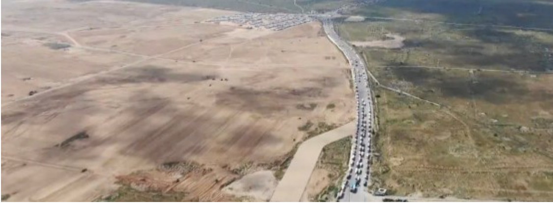
(شاحنات المساعدات مكدسة في الجانب المصري بينما يموت أهالي غزة جوعاً على الجانب الآخر)

الآلاف في غزة يتوافدون نحو الشاطئ للحصول على طعام أسقطته طائرات أردنية في البحر. وثق المرصد الأورومتوسطي لحقوق الإنسان، الاثنين ٢٦ فبراير، شهادات جديدة صادمة لفلسطينيات من قطاع غزة، تعرّضن للتفتيش العاري والعنف الجنسي والتعذيب والمعاملة اللاإنسانية، من خلال التحرش الجنسي والتهديد بالاعتصاب، خلال احتجازهن لمدد متفاوتة من قبيل قوات جيش الاحتلال.