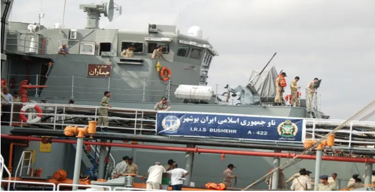
(سفينة عسكرية إيرانية ترسو في ميناء بورتسودان)

أكد وزيراً خارجية إيران، حسين أمير عبد اللهيان، ونظيره السوداني، علي الصادق علي، في طهران، على إعادة فتح السفارتين الإيرانية والسودانية واستئناف المهام الدبلوماسية لسفيري البلدين، في سياق جهود توسيع العلاقات الثنائية.