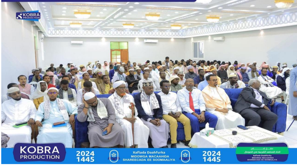
(جانب من حضور حفل إنشاء اتحاد المعاهد الشرعية في الصومال)

أعلن في العاصمة الصومالية، مقديشو، في النصف الثاني من شهر رمضان المبارك عن تكوين مؤسسة إدارية تنضوي تحتهما كافة المعاهد الشرعية باختلاف مشاربها الفكرية، سعياً لتوحيد السياسات والأنظمة والجهود.