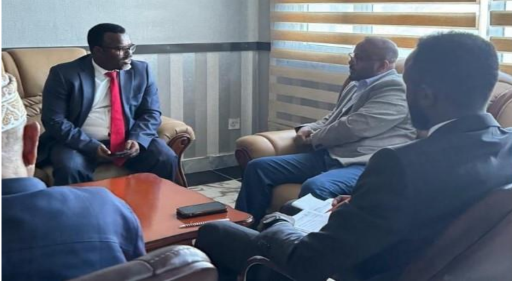
(السفير الإثيوبي (يسار) أثناء إبلاغه بقرار الطرد)

أبلغت الحكومة الصومالية السفير الإثيوبي مختار محمد واري الخميس (٤ إبريل) بمغادرة الصومال خلال ٧٢ ساعة، كما أمر مجلس الوزراء الصومالي بإغلاق قنصليتي إثيوبيا في هرجيسيا (عاصمة "أرض الصومال") وغاروي (عاصمة "بونت لاند")، وطالب الدبلوماسيين بمغادرة البلاد، بسبب سياسة إثيوبيا العدوانية تجاه الصومال.