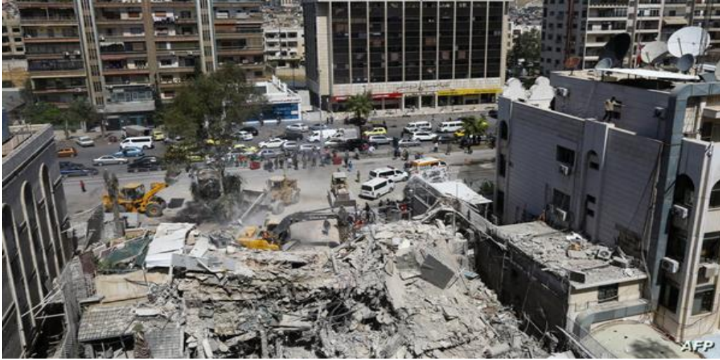
(ما تبقى من القنصلية الإيرانية في دمشق)

تؤكد وسائل إعلام عبرية إن "إسرائيل" تأخذ تهديدات إيران ضدها على محمل الجد، وأنها تستعد لكافة السيناريوهات. وانطلاقاً من هذه الاعتبارات ظلت "إسرائيل" في حالة تأهب تحسباً لرد إيراني محتمل، واستدعت احتياطيات قواتها الجوية وألغت إجازات الجنود.