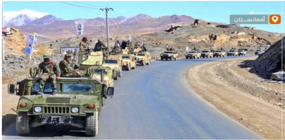
(طابور عسكري من سيارات هامر الأمريكية التي تم غنمها الإمارة وتم إصلاحها بعد التحرير)

وكانت الحكومة الأفغانية قد نفذت عمليات واسعة ضد تنظيم داعش (خراسان) الذي شن تفجيرات دامية استهدفت المساجد والأسواق والأماكن العامة، أجهضت قدرات هذا التنظيم، وتمكنت من إخراجه من أفغانستان.