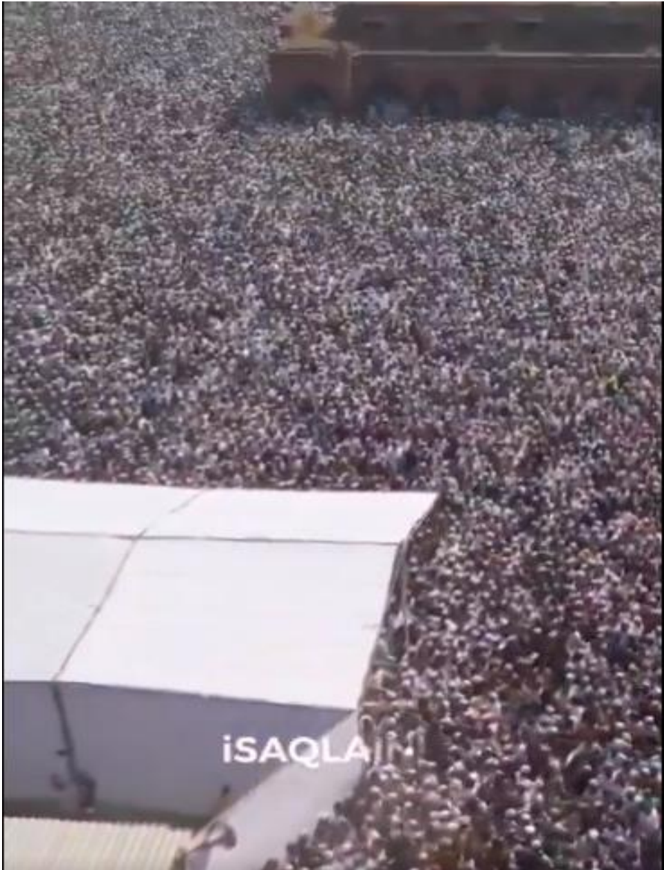
(جانب من حضور الجنازة المهيبة)

خرج عشرات الآلاف من الهنود في جنازة مهيبة للزعيم المسلم الهندي مختار أنصاري، الذي يُعتقد في أوساط المسلمين أنه كان يُعطى سمًا بطيئًا أثناء وجوده في سجن أوتار براديش، وتوفي قبل أسبوع في مستشفى باندا التي نُقل إليها بعد تدهور حالته الصحية. وقد اشتكى أنصاري (٦٣ عاماً) مراراً وتكراراً إلى المحكمة خلال جلسات الاستماع من أنه لا يتلقى المرافق الطبية الكافية في السجن. وكان أنصاري خلف القضبان منذ عام ٢٠٠٥ وتم إيداعه في سجن باندا. وفي ديسمبر الماضي، حكم عليه الأنصاري بالسجن المشدد لمدة خمس سنوات ونصف في قضية عمرها ٢٦ عاماً.