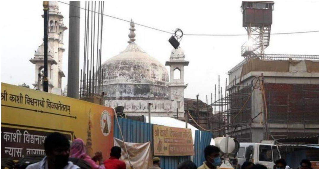
(مسجد جيانفابي التاريخي، حيث جرى تقسيمه بين المسلمين والهندوس)

رفضت المحكمة العليا يوم الاثنين وقف أمر محكمة فاراناسي والذي سمح بموجبه للأحزاب الهندوسية بإقامة طقوسهم في القبو الجنوبي لمسجد جيانفابي التاريخي. إذ أمرت المحكمة العليا الطرفين بالحفاظ على الوضع الراهن "لتمكين كلا المجتمعين من أداء الصلوات الدينية". وسابقاً، قد قام القوميون الهندوس بحملة تطالب ببناء معبدهم مكان المسجد التاريخي، بينما يؤكد المسلمون أن المسجد بني على مباني الوقف وأن قانون أماكن العبادة (أحكام خاصة) لعام ١٩٩١ يمنع تغيير طابعه. أي مكان للعبادة كما كان في ١٥ أغسطس ١٩٤٧.