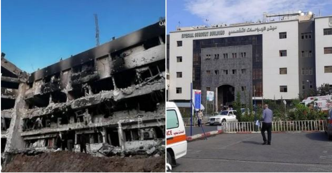
(مجمع الشفاء قبل وبعد العدوان)

تواصل عدوانها.. "إسرائيل" دمرت مستشفى الشفاء وقتلت المئات بينهم فريق إغاثي غربي: