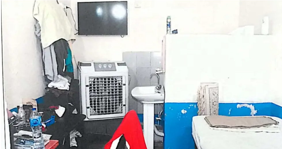
(صورة لزنزانة عمران خان الانفرادية)

حكمت المحكمة العليا في إسلام آباد، الاثنين، براءة رئيس حركة الإنصاف الباكستانية السابق عمران خان ونائب رئيسها شاه محمود قريشي في قضية التشفير. وفي حديثه لوسائل الإعلام في إسلام آباد بعد صدور الحكم، قال المحامي جوهر إن العدالة انتصرت اليوم، وسيخرج عمران خان من السجن قريباً جداً. وتتعلق قضية التشفير بوثيقة دبلوماسية استخدمها عمران خان في تجمع حاشد لحزبه للإشارة إلى تهديده من قبل الولايات المتحدة، وزعمت لائحة الاتهام الصادرة عن وكالة التحقيقات الفيدرالية، أن عمران لم يعيدها أبداً. من جهته، يعتبر حزب "إنصاف" أن تلك الوثيقة تحتوي على تهديد من الولايات المتحدة بإطاحة عمران كرئيس للوزراء، وتراها دليلاً واضحاً على ذلك.