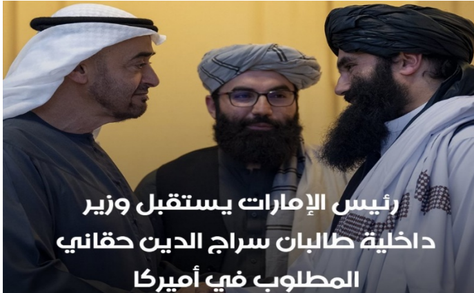
رئيس الإمارات يستقبل وزير داخية طالبان سراج الدين حقاني المطلوب في أميركا

دعا الرئيس الروسي فلاديمير بوتين إلى بناء وتوسيع علاقات مع الحكومة الأفغانية مؤكداً أنها الجهة التي تمثل السلطة في أفغانستان وتسيطر عليها. جاء ذلك خلال كلمة للرئيس الروسي أمام منتدى بطرسبورغ الاقتصادي الدولي في نسخته الـ ٢٧ هذا العام المقام في الفترة