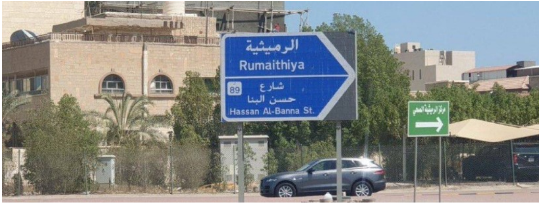
(أحد الأسماء التي سيتم إزالتها في الكويت بموجب القرار الجديد)

كلف مجلس الوزراء الكويتي وزير الأشغال العامة ووزير الدولة لشؤون البلدية باتخاذ الإجراءات اللازمة لاستبدال أسماء لشخصيات ليست من رؤساء الدول على الطرق والميادين، وذلك للتوجه نحو ترقيمها وموافاة مجلس الوزراء بمشروع قرار بهذا الشأن. وحسب قرار مجلس الوزراء الكويتي، فسوف تقتصر تسمية بعض الشوارع على السلاطين والملوك والحكام والأمراء ورؤساء الدول.