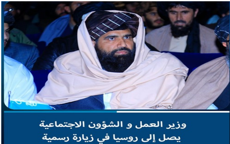
وزير العمل و الشؤون الاجتماعية يصل إلى روسيا في زيارة رسمية

من ٥ إلى ٨ يونيو، والذي حضره وفد رسمي من الحكومة الأفغانية برئاسة الملا عبد المنان العمري وزير العمل والشؤون الاجتماعية.