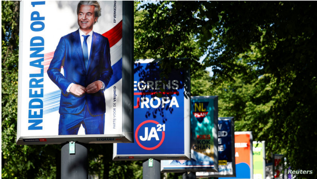
(جانب من الحملة الانتخابية في هولندا ويظهر فيها خيرت فيلدرز السياسي اليميني المعادي للإسلام)

توجه ٤٠٠ مليون في ٢٧ دولة عضو في الاتحاد الأوروبي إلى صناديق الاقتراع لانتخاب البرلمان الأوروبي القادم. وتشير استطلاعات الرأي إلى أن الأحزاب المحافظة اليمينية المتطرفة والمتشددة يمكن أن تحتل المركز الأول في تسع دول في الاتحاد الأوروبي ، بما في ذلك فرنسا وهولندا، والثانية أو الثالثة في تسع دول أخرى، بما في ذلك ألمانيا وإسبانيا والبرتغال والسويد.