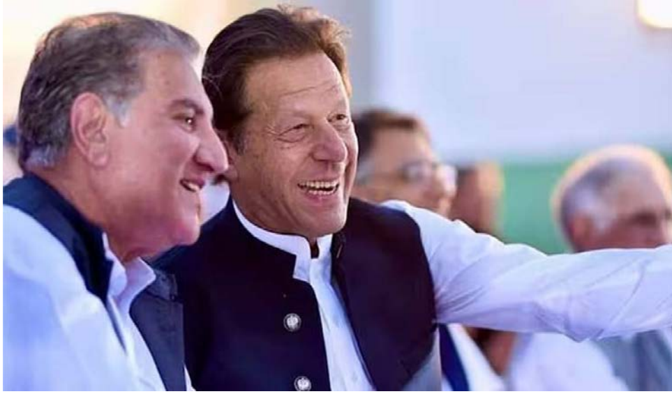
(عمران خان وقريشي)

حكمت المحكمة العليا في إسلام آباد، الاثنين، براءة رئيس حركة الإنصاف الباكستانية السابق عمران خان ونائب رئيسها شاه محمود قريشي في قضية التشفير. وفي حديثه لوسائل الإعلام في إسلام آباد بعد صدور الحكم، قال المحامي جوهر إن العدالة انتصرت اليوم، وسيخرج عمران خان من السجن قريباً جداً. وتتعلق قضية التشفير بوثيقة دبلوماسية استخدمها عمران خان في تجمع حاشد لحزبه للإشارة إلى تهديده من قبل الولايات المتحدة، وزعمت لائحة الاتهام الصادرة عن وكالة التحقيقات الفيدرالية، أن عمران لم يعيدها أبداً. من جهته، يعتبر حزب "إنصاف" أن تلك الوثيقة تحتوي على تهديد من الولايات المتحدة بإطاحة عمران كرئيس للوزراء، وتراها دليلاً واضحاً على ذلك.