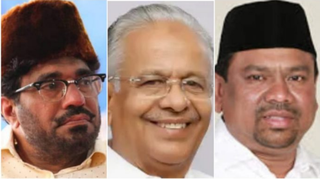
(فوز مرشحي رابطة مسلمي الاتحاد الهندي الثلاثة في ولاية كيرالا)

فاز ما لا يقل عن ١٥ مرشحاً مسلماً بمقاعد البرلمان في جميع أنحاء الهند، وقد نجح جميع المرشحين المسلمين الذين شاركوا في الانتخابات في ولاية أوتار براديش الهندية، من تحالف أحزاب المعارضة في الهند، بينما واجه حزب بهاراتيا جانانا الهزيمة في معقله في ولاية أوتار براديش حيث حصل حزب ساماجوادي على ٤٢ مقعداً، وبالتالي كان على حزب بهاراتيا جانانا، الذي بنى معبد رام بدلاً من مسجد بابري، أن يعترف بهزيمته في أيودھيا أيضاً.